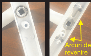
Alt produs Produs Yale