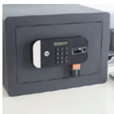
Vysoké zabezpečení s rychlým přístupem

Využijte výhod snadného otevření díky vestavěnému snímači otisků prstů a uchovávejte své cenné věci v bezpečí. Do paměti můžete uložit až 100 různých otisků prstů.