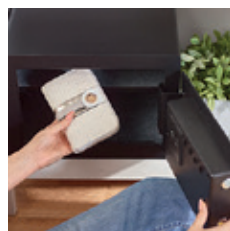
Zvýšená míra zabezpečení pro dokonalý klid

Navíc jsou zde moderní funkce jako otevírání ověřením otisku prstu, automatické otevírání dvířek a LCD displej s klávesnicí pro rychlý přístup. Vnitřní háčky vám pomohou věci uvnitř uspořádat, zatímco díky osvětlení interiéru budete mít o všem dokonalý přehled.