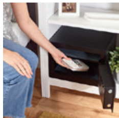
Moderní design vhodný do vaší domácnosti.

Využijte výhod snadného otevření díky vestavěnému snímači otisků prstů a uchovávejte své cenné věci v bezpečí. Do paměti můžete uložit až 100 různých otisků prstů.