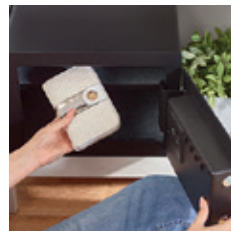
Zvýšená míra zabezpečení pro dokonalý klid

Navíc jsou zde moderní funkce jako otevírání ověřením otisku prstu, automatické otevírání dvířek a LCD displej s klávesnicí pro rychlý přístup. Vnitřní háčky vám pomohou věci uvnitř uspořádat, zatímco díky osvětlení interiéru budete mít o všem dokonalý přehled.