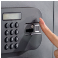
Vysoké zabezpečení s rychlým přístupem

Využijte výhod snadného otevření díky vestavěnému snímači otisků prstů a uchovávejte své cenné věci v bezpečí. Do paměti můžete uložit až 100 různých otisků prstů.