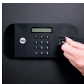
Nadřazený mechanický zámek s klíčem s jedním profilem