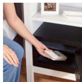
Motorizovaný zamykací mechanismus se dvěma západkami (20 mm) odolnými vůči přeřznutí a laserem řezaná dvířka pro maximální ochranu proti násilnému vniknutí.