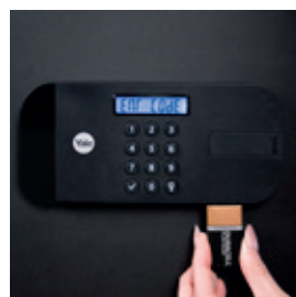
9V baterie pro nouzové otevření při vybití napájecích baterií